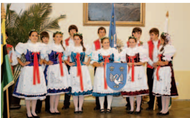
Mládež v otnických krojích.