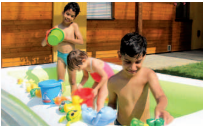
Léto v Dětském domově LILA.