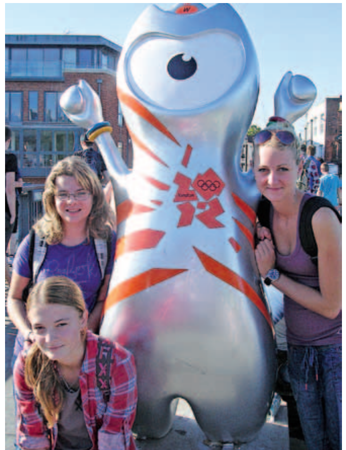
Žáci ZŠ Otnice v Anglii I.