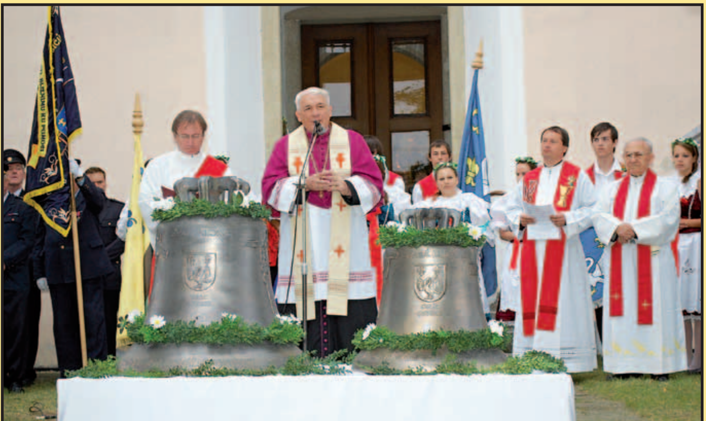
... a nové zvony před prvním vyzváněním.