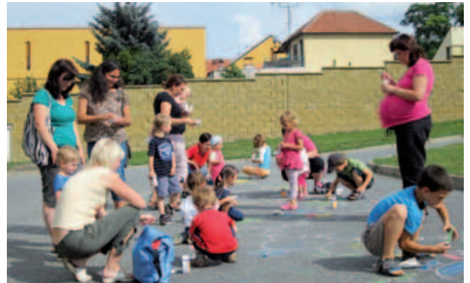
Křídové malování před radnicí.