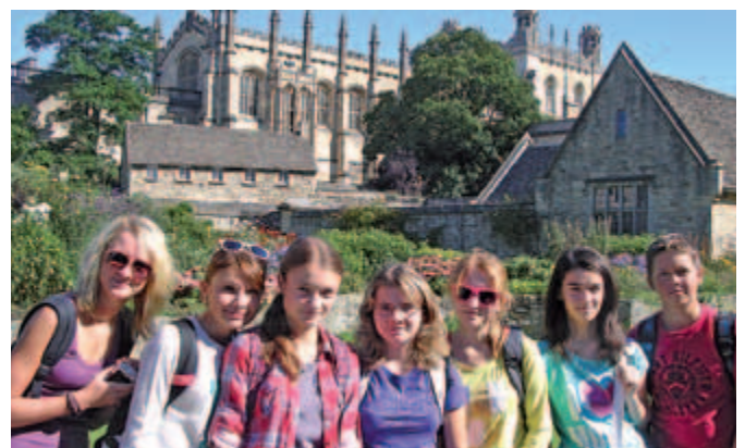
Žáci ZŠ Otnice v Anglii II.