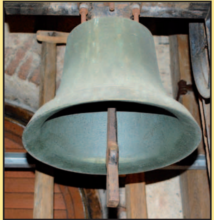
Původní zvony dozněly ...