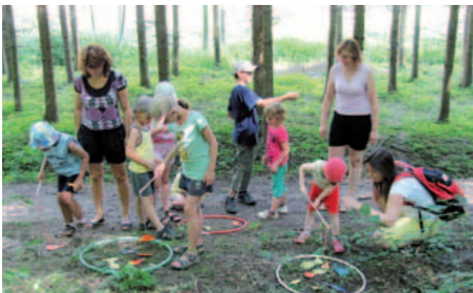
Děti z LILY v přírodě.