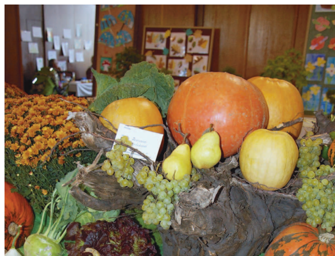
Oblastní výstava Slavkov