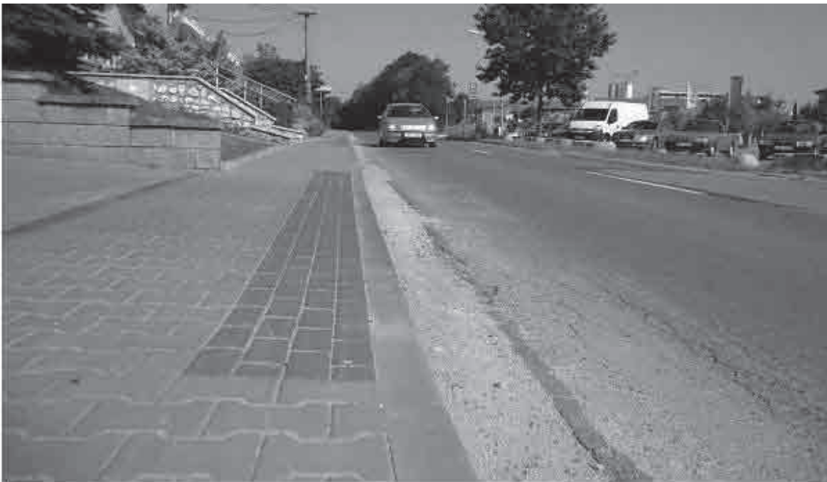
Obyvatelům otnické ulice Na Konci chybí zastávka.

Otnice – Zhruba půlkilometrovou cestu na autobusovou zastávku v centru Otnic budou muset obyvatelé ulice Na Konci a několik zaměstnanců tamní firmy Beton Brož podnikat i nadále. O iniciativě místních, kteří sepsali petici za zřízení nové zastávky v ulici, už Vyškovský deník Rovnost informoval. Záměr nicméně od počátku narážel na mnoho překážek. Nakonec se zastupitelé na svém posledním zasedání usnesli, že projekt odloží na neurčito.