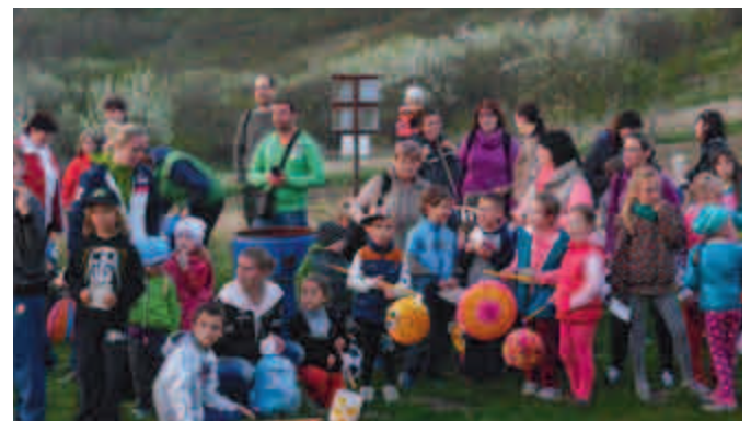
Návštěva vodníka Sadkáče.