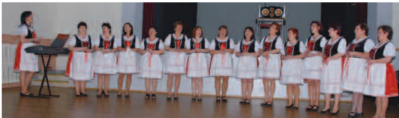
Ženy z Kosu v nových krásných krojích.