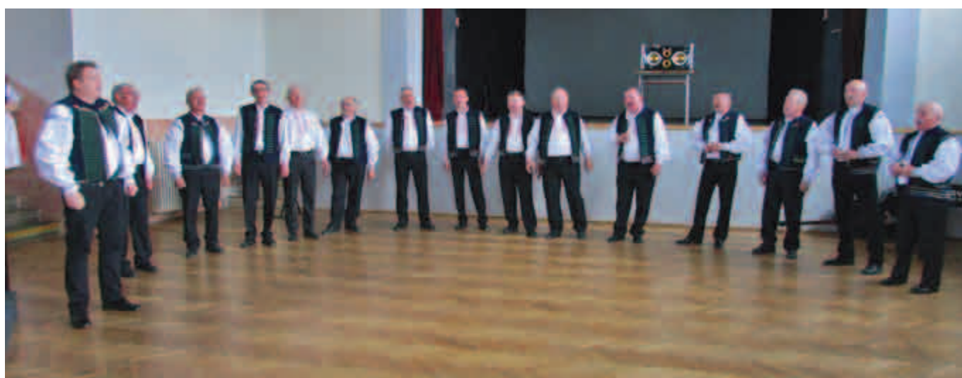
Mužáci z Popic.