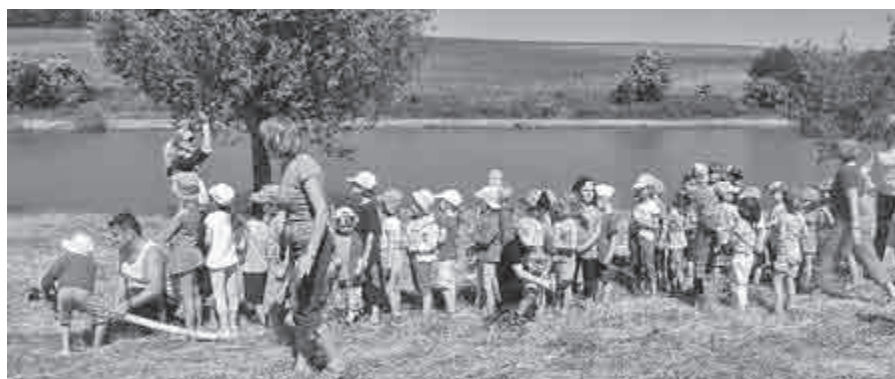
Děti na hasičském cvičení.