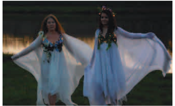
Vily od rybníka Poltní.