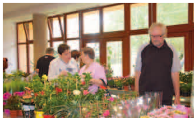
Tradiční zahrádkářská výstava.