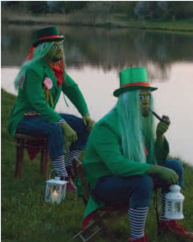
Poltnák a Sadkáč.