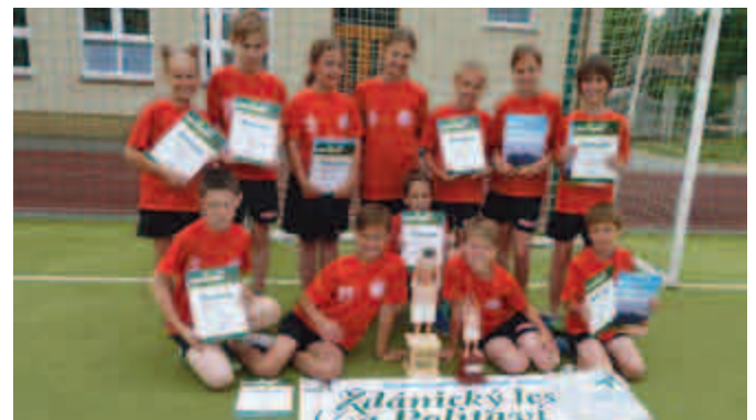
Vítězný tým ve vybíjení.