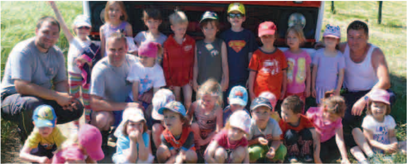
Děti na hasičském cvičení.