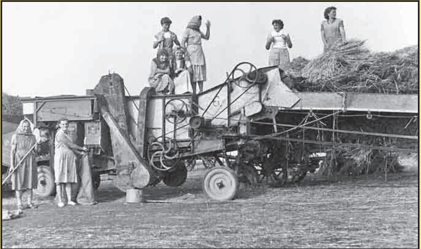
Skizeň obilí na otnických polích v polovině minulého století...