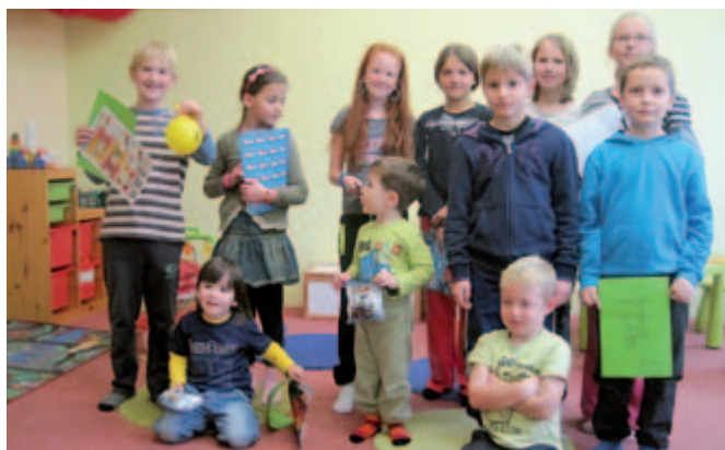
Den plný her v Otnickém Sadu