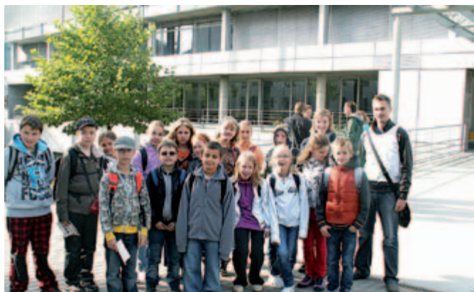
5. A na návštěvě Mendlovy univerzity