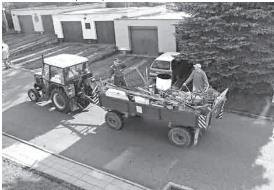
20. října oddíl stolního tenisu posbíral po obci 3850 kg železného šrotu.