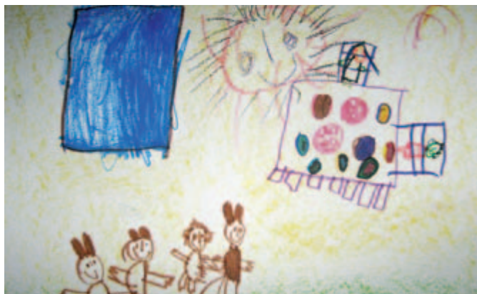
Obrázek od Magdalenky Valové