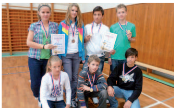
Vítězové Otnického čertíka