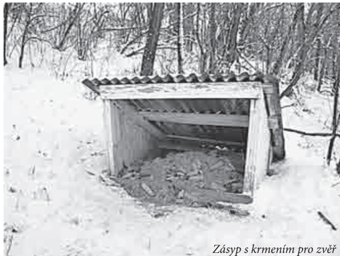
Zásyp s krmením pro zvěř

Vzhledem k tomu, že v příštím roce končí desetiletá nájemní smlouva o pronájmu honitby, bylo prioritou občanského sdružení MS HUBERT uzavřít novou nájemní smlouvu na dalších desetiletí k vykonávání práva myslivosti od Honebního sdružení Otnice. Tato smlouva se nám podařila na valné hromadě HS Otnice uzavřít za velké