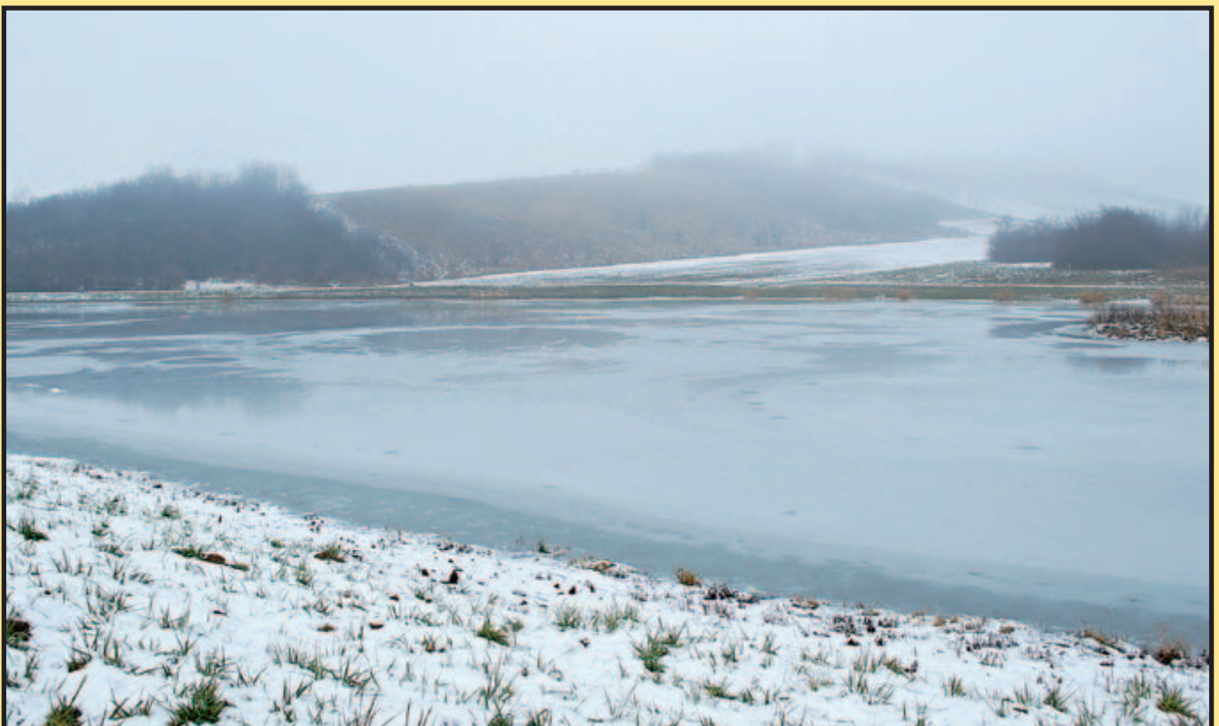
...prosincový den. Po vydatném sněžení přišly teploty nad nulou.