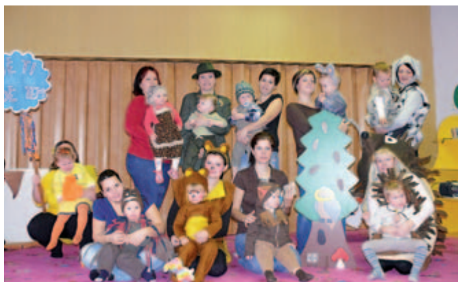
Jak zvířátka našla domov